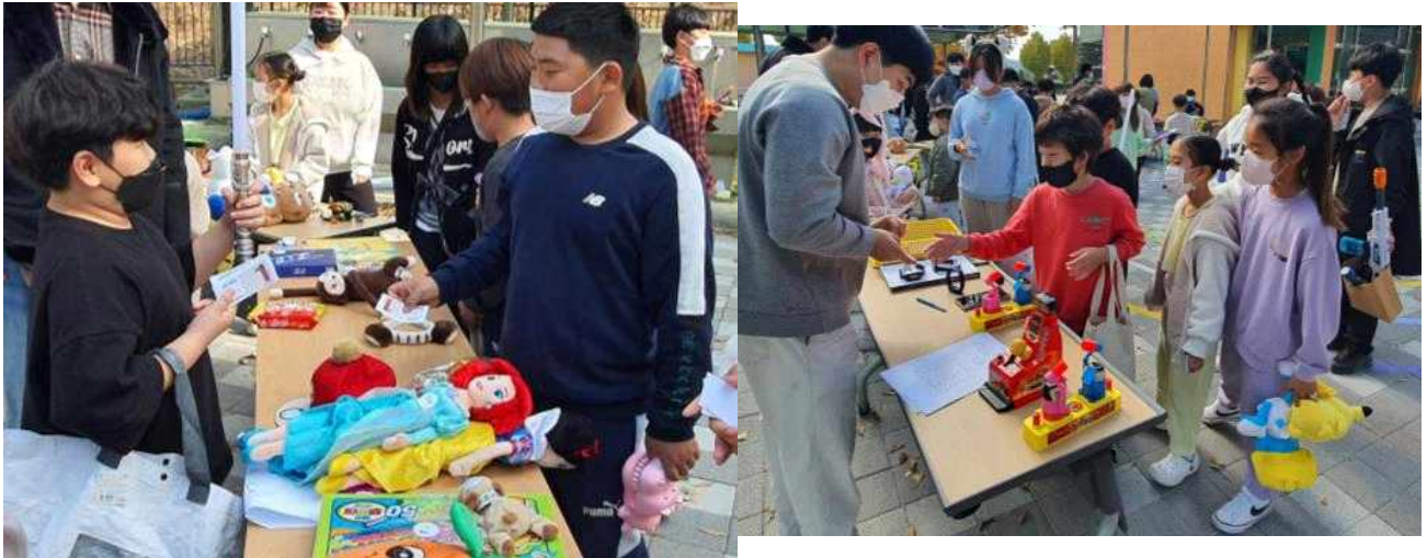
3) 게임을 이기면 해피머니를 얻을 수 있음.