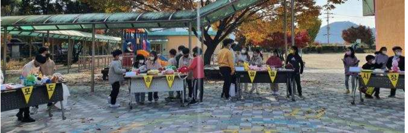
1) 가족 별 판매대의 모습